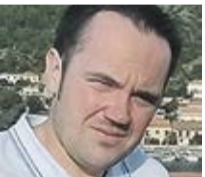
Piše Ivan Plantić

Stvar je jednostavna. Sindikati trebaju odrediti svoje prioritete i onda se za njih izboriti na odgovarajući način. Ako je pitanje statusa člana i nečlana sindikata krucijalno, jedino mjesto da se ono riješi jest Ustav. Stručno i znalački precizno. Sve drugo je stvar nestruke i demagogije. I neće proći. A s rješenjima kojih se domisle neki sindikalisti u dogovoru s nekim političarima, nažalost, sindikati će se samo kompromitirati oko onog što bi im trebalo biti ključno – solidarnosti!