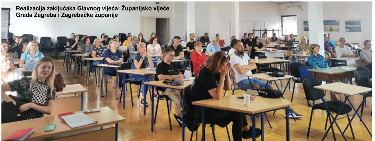
Realizacija zaključaka Glavnog vijeća: Županijsko vijeće Grada Zagreba i Zagrebačke županije

lektivne ugovore, predsjednik je pojasnio je da se zasad pozivu Preporoda za zajedničkim nastupom prema Ministarstvu odazvao Nezavisni sindikat zaposlenih u srednjim školama s kojim su ostvareni konkretni dogovori. Pojedinačno je predstavljeno 20-tak zahtjeva sindikata Preporod koji obuhvaćaju sve koji rade u školama učitelji i nastavnike, stručne suradnike, spremačice te administrativno i tehničko osoblje.