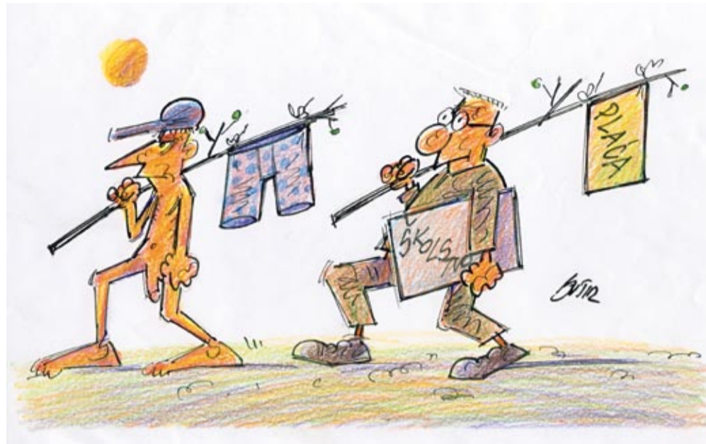
Ilustracija: Slobodan Butir

Nadalje, u obrazloženju se navodi kako je ovako ugovoreno postotno uvećanje koeficijentata pravno dvojbeno s ustavno pravnih aspekata jednakosti i suprotno načelima radnog zakonodavstva te da je upitna i usklađenost sa zahtjevima europskog zakonodavstva. Treba biti jako, jako naivan pa povjerovati da se nešto nezakonito moglo provoditi punih 11 godina. Uostalom, ako se doista koeficijent složenosti poslova ne bi smio mijenjati kolektivnim ugovorom zar se to pravo ne bi moglo