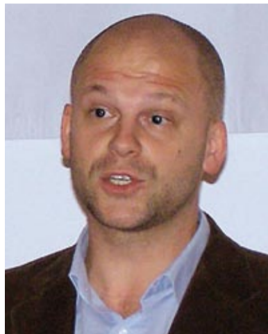
Piše: Doc. dr. sc. Viktor Gotovac, Katedra za radno i socijalno pravo Pravnog fakulteta Sveučilišta u Zagrebu

tripartitnim tijelima i reprezentativnosti za kolektivno pregovaranje već je dosta kazano. Ali ono na što treba ukazati, čime se treba baviti, jer nažalost time bi se mogli baviti i nadležni sudovi, jesu greške koje su vjerojatno počinjene, na koje se nije mislilo niti računalo. A one bi mogle koštati, možda i više no uštede koje su postignute.