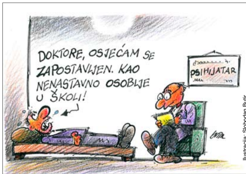
Ilustracija: Slobodan Butir

Naime, nama koji radimo u osnovnom školstvu nikako nije jasno zašto smo „manje vrijedni” od kolegica i kolega iz srednjeg školstva? Ne pada mi ni na kraj pameti stvarati razdor među nama, ali ovakvo pitanje se nameće iz vrlo jednostavnog razloga. Zbog čega, primjerice, u srednjoj glazbenoj ili bilo kojoj drugoj srednjoj strukovnoj školi koja ima 80 ili 90 ili 130 učenika, tajnica i voditeljica računovodstva mogu raditi u punom radnom vremenu, dakle bez obzira na broj učenika, a u osnovnoj školi ne mogu, odnosno ti poslovi su vezani brojem učenika. I u Pravilniku o djelokrug rada tajnika te administrativno-tehničkim i pomoćnim poslovima koji se obavljaju u sred-