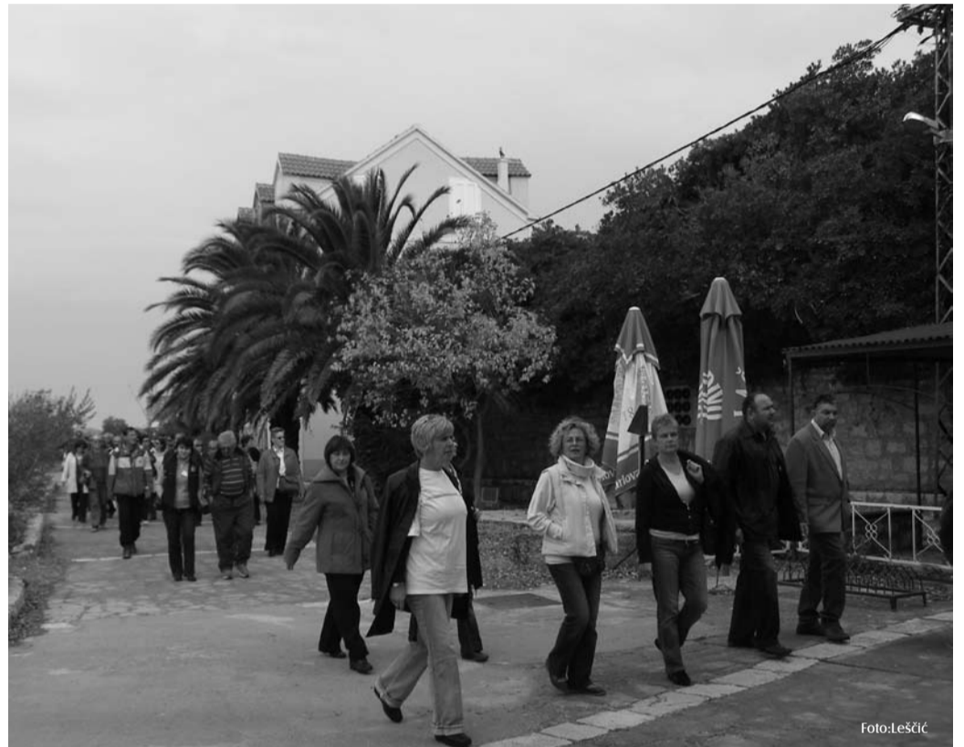
Na otoku koralja

ravno, na subotnjem izletu. Eh, dragi naši Dalmatinci, kad biste vi samo znali, što nama „sjevernjacima“ znači takav dan u listopadu! Pogotovo stoga što nas je i ove godine iz Zagreba ispratila hladna i uporna kiša, koja kao da postaje stalna pratnja naših sindikalnih putovanja i okupljanja. Udahnuti punim plućima more i borovinu, nakon oblačnog jutra dočekati bljesak sunca na pučini, prošetati gotovo premirnim uličicama Zlarina i pojesti tek ubrani nar nama naviklima na hladnu, vlažnu jesensku maglu ravno je čudu. No, sudeći po smijehu i žamoru koji su vladali na našem brodiću, nikome nije bilo dosadno. Jer, makar bili negdje tisuću puta, dobro i veselo društvo, čaša vina i ukusna „spiza“ i dobro poznato mjesto pretvore u posve novi doživljaj. A uvečer se plesalo, pa i pjevalo, bilo je i gitare i harmonike, i razgovora dugo u noć. Pa ako se nekome i spavalo ujutro, nije se primjećivalo – atmosfera je do samog kraja ostala radna i ozbiljna ondje gdje je tako moralo i biti. Priča se (posve neslužbeno i neprovereno) da su se već počeli kovati planovi za novi susret. I nije važno gdje bi se on mogao dogoditi, samo neka to bude što prije. Do tada – adio, dragi prijatelji!