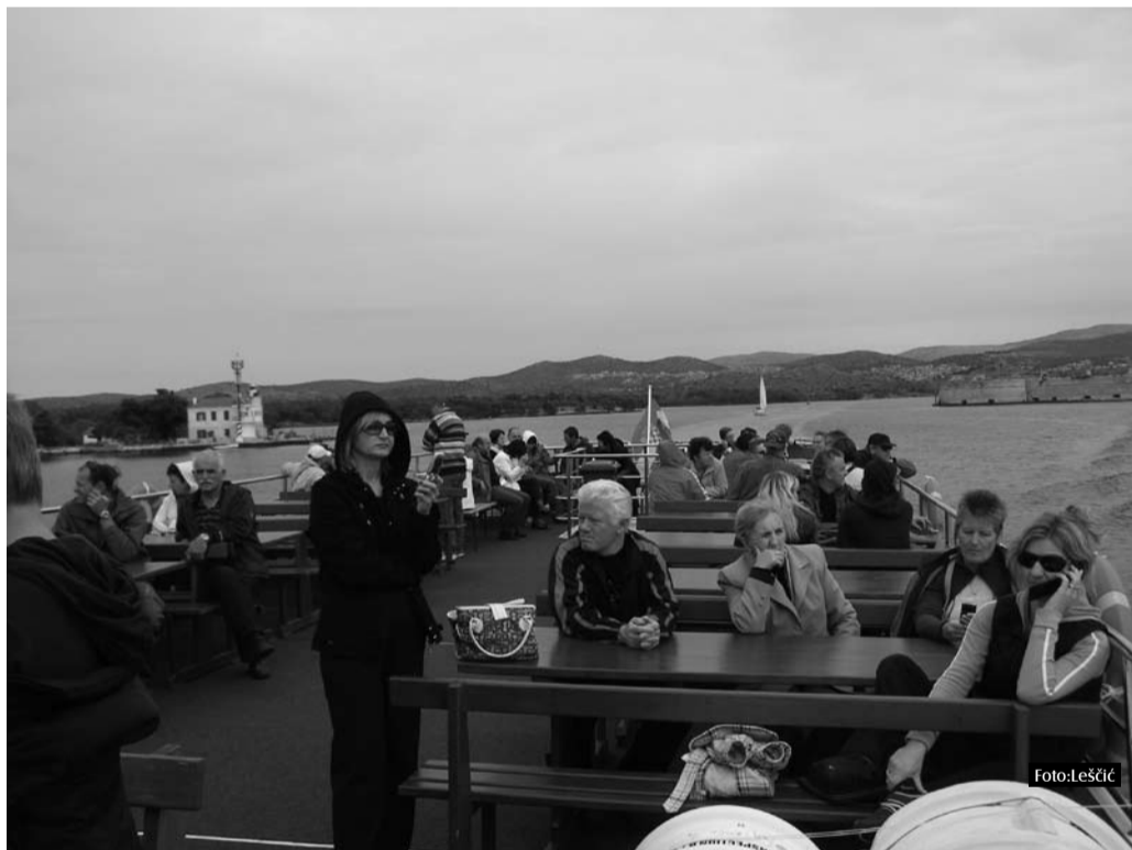
Nadomak Krešimirovu gradu

Budimo iskreni, drage kolegice i kolege povjerenici, čemu se najviše radujete kad se prijavljujete za sindikalni seminar? Bijegu iz školske rutine i izostanku s nastave? Ne vjerujem, jer poznavajući nas prosvjetare, bez obzira na prava iz kolektivnog ugovora, mi sve svoje izostanke ionako odradimo. Zanimljivim predavanjima i informacijama o novim zakonima i pravilnicima? Možda ih očekujemo svjesni važnosti dobre informiranosti svakog sindikalnog povjerenika, ali ono što nas zapravo najviše raduje ipak su susreti s ljudima s kojima se uglavnom i vidamo jednom godišnje, na sindikalnim susretima, a ipak ih smatramo dragim prijateljima. Veže nas, naime, bez obzira na sve naše različitosti, na škole i mjesta iz kojih dolazimo, na različite poslove koje obavljamo i još različiti uvjete u kojima to činimo, jedna na žalost sve rjeđa, ali za svaki sindikat dragocjena osobina – vjera u snagu zajedništva kao jedine mogućnosti, kao jedine nade za postizanje bilo kakvih promjena nabolje. I zato smo se i ove godine u Vodicama družili i veselili na mnogim kavicama, na plesu i, na