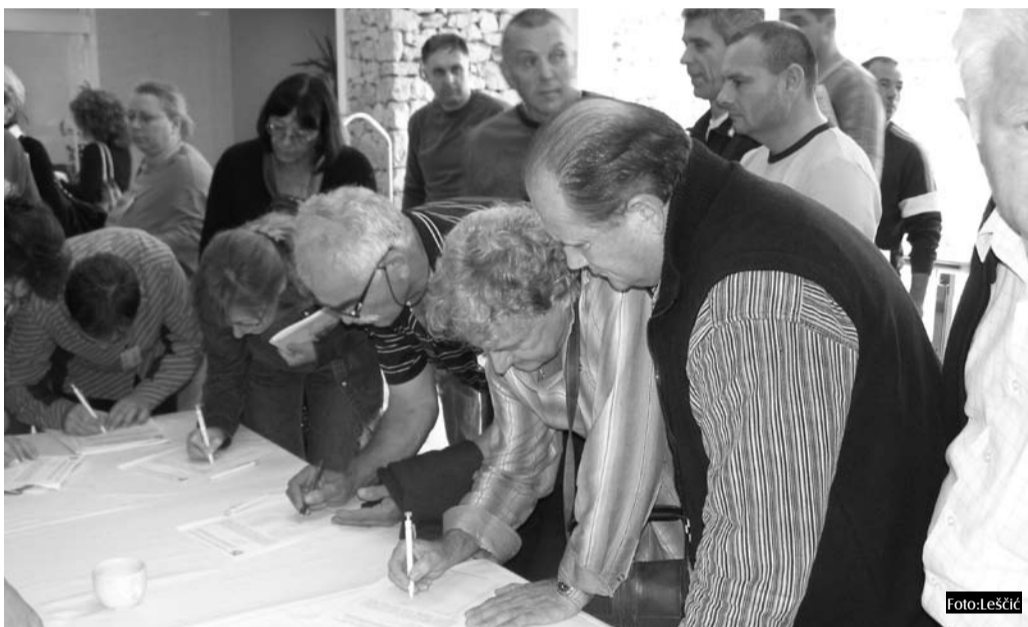
Sudionici savjetovanja u Vodicama potpisuju Zahtjev

Rješenje navedenog problema u Sindikatu Preporod vidimo na način da Vlada Republike Hrvatske žurno donese Uredbu kojom bi se svim zaposlenim u obrazovnim ustanovama postojeći obračunski koeficijenti jednokratno podigli za 12%. Za ovu je namjenu u državnom proračunu za 2009. godinu treba, pored postojećih 5.4 mld. kuna, osigurati dodatnih 600 mil. kuna, odnosno za plaće zaposlenih u obrazovanju u 2009. bi trebalo osigurati 6 mld. kuna. Potpisivanje spomenutog Zahtjeva u idućih će mjesec dana biti omogućeno svim zaposlenicima obrazovnih ustanova.